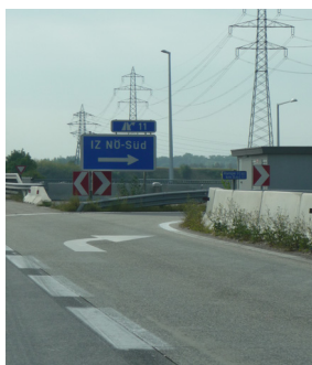
Autobahnanschlussstelle IZ NÖ-Süd