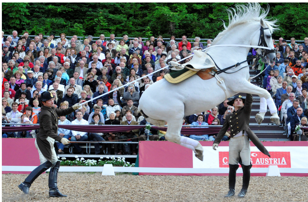
Vorführung Spanische Hofreitschule Heldenberg

Die Spanische Hofreitschule – Bundesgestüt Piber verpflichtete sich zu konkreten Gegenleistungen (Vorführungen, Führungen).